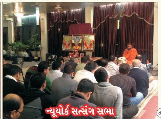
ન્યૂયોર્ક સત્સંગ સભા