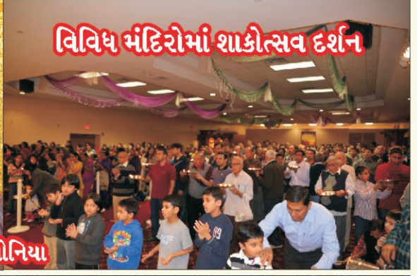
વિવિધ મંદિરોમાં શાકોત્સવ દર્શન