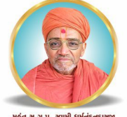
महत स्व.पु.पु. स्वामी धर्मदत्तनाराय

श्री नरनारायणदेव द्दिशाब्दी महोत्सव - भुज