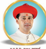
प.पू.ध.धु. १००० आचार्य श्री दीशलेनदभसांछु भडारय