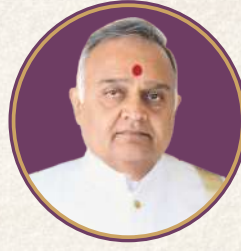
પ.પૂ. મોટા મહારાજશ્રી