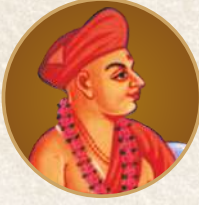
અ.નિ. સ.ગુ. બ્રહ્માનંદ સ્વામી