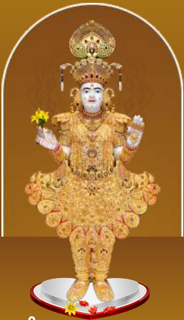
શ્રી ઘનશ્યામ મહારાજ